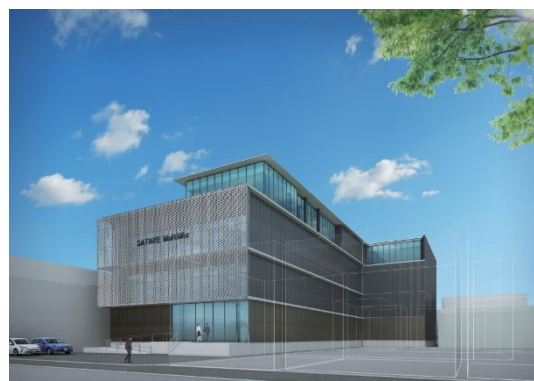
埼玉県さいたま市に計画しているシングルユースバイオリアクター・ミキサーの製造拠点イメージ

現状、シングルユースバイオリアクター・ミキサーや消耗品のシングルユースバッグは、ほぼ海外製品が用いられております。国内にワクチン製造の設備が整っても、パンデミックなどの緊急時にこれらの製品の供給が途絶えてしまうと十分なワクチン製造が行えないというリスクを抱えています。国内でこれらの製品の技術向上と製造能力が確保されてこそ、「国内でワクチンを円滑に生産できる能力を確保する」という事業目的が達成されるものと当社は考えております。